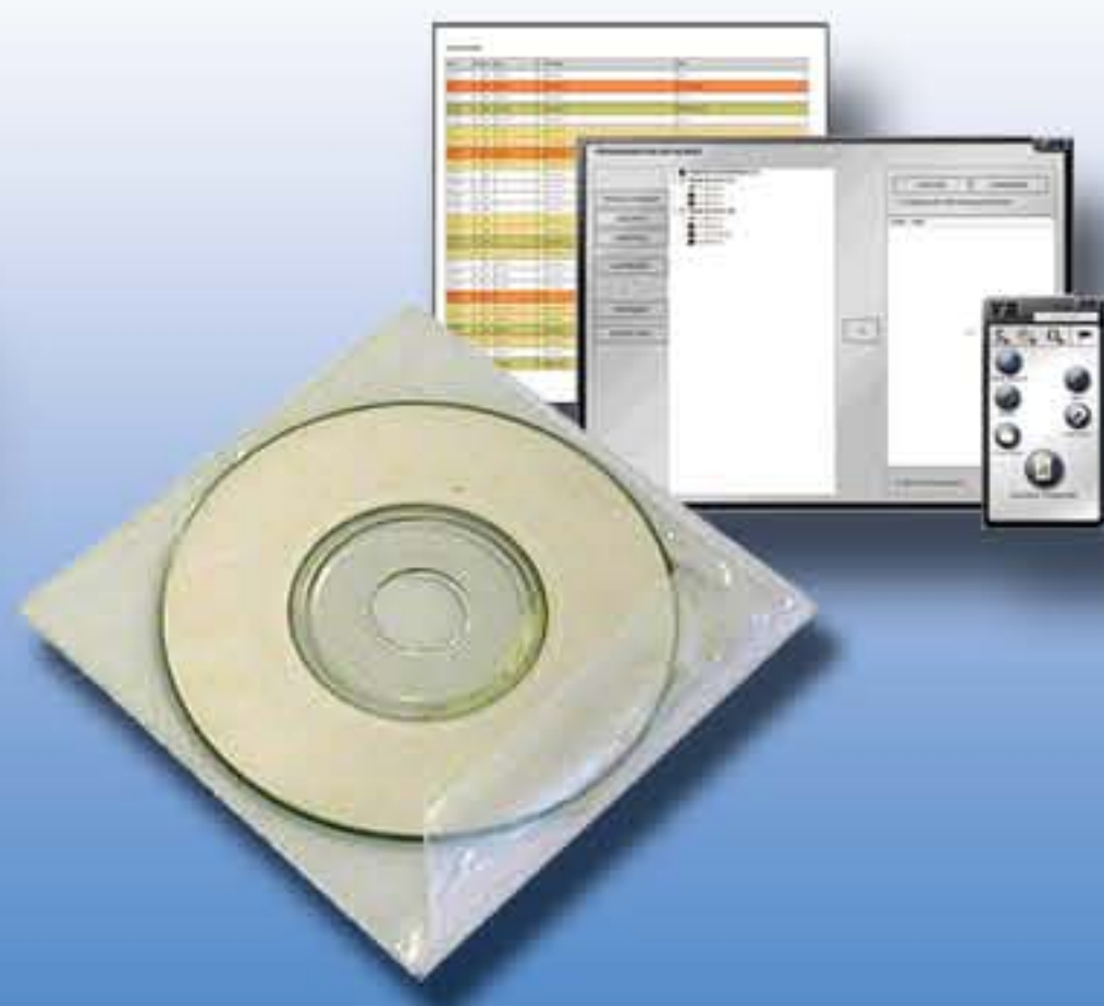
Logiciel Vigironde Multisites