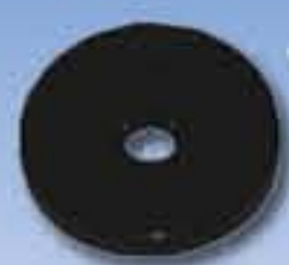
Tag RFID mural