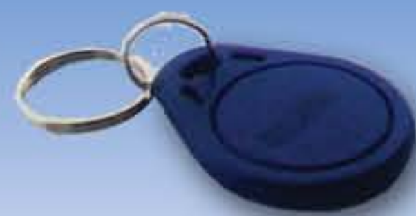
Tag RFID porte clé