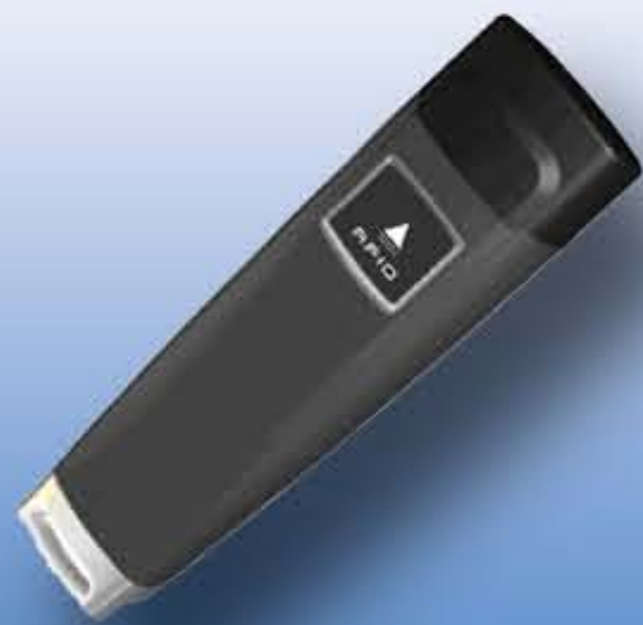
Lecteur portatif RFID