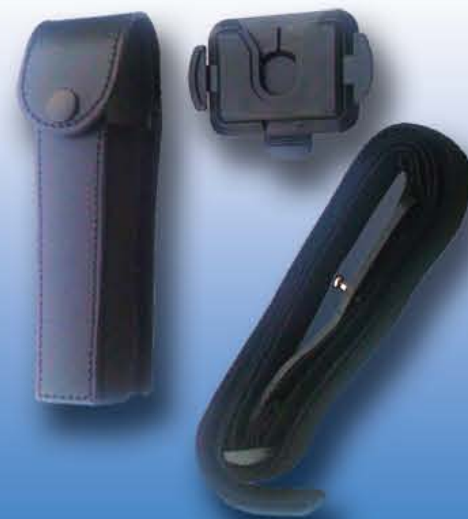
Housse de transport en cuir