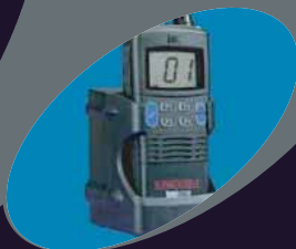
Le chargeur-support fourni.

S.A. au capital de 40 000 € R.C.S : Paris B 390 292 704 N° SIRET : 390 292 704 00041 APE : 514S