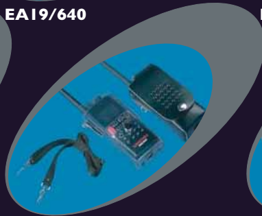
CLC640 & CLC940