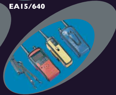
CFC640 Rouge, jaune et bleu